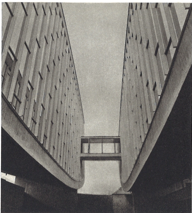
Pamätník Slovenského národného povstania v Banskej Bystrici