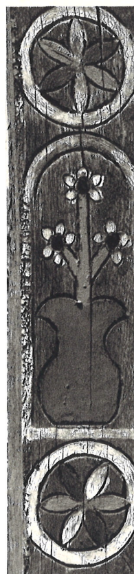
Detvianske vyrezávané kríže