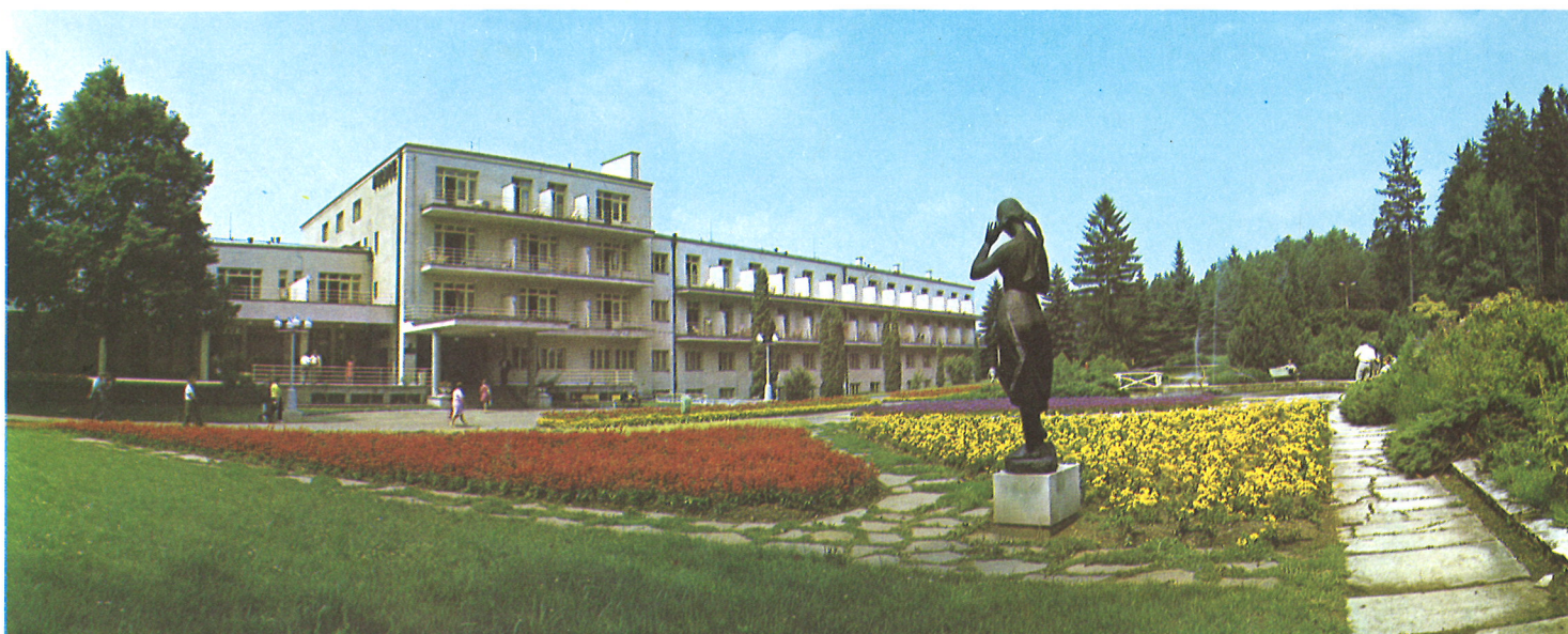
Liečebný dom Palace V liečivej vode sliackych prameňov