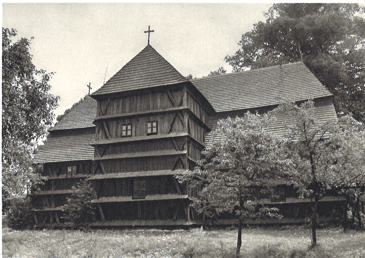
Artikulárny drevený kostol v Hronseku