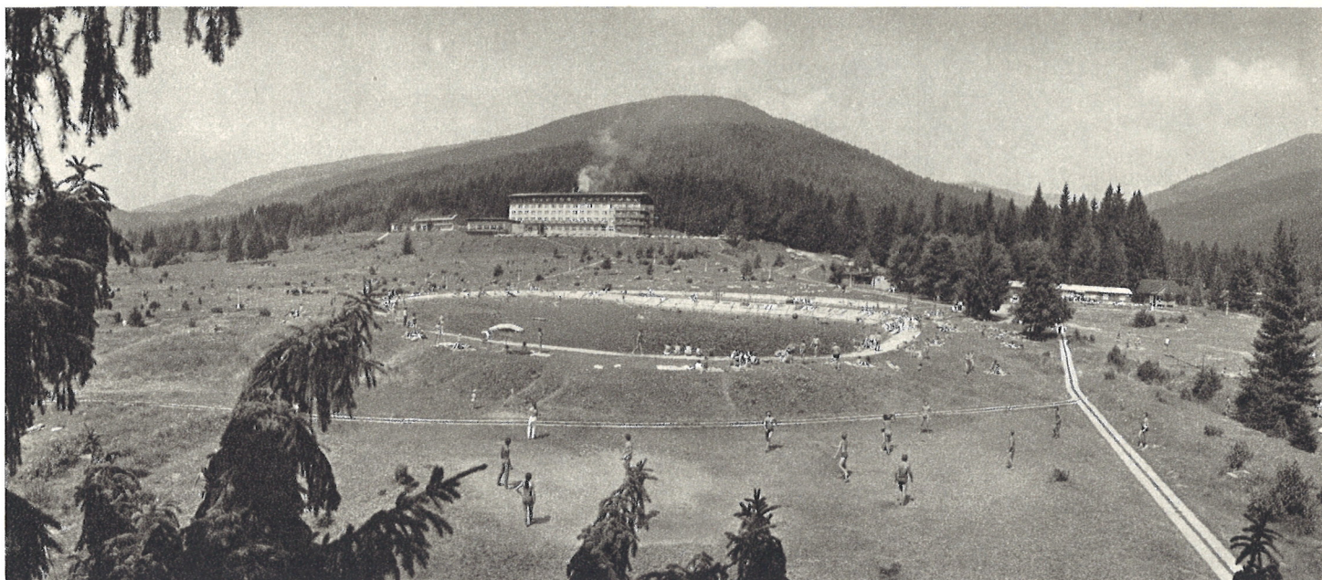
Na Tál'och v Nizkych Tatrách