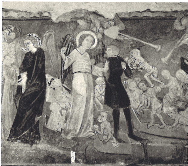
Gotický kostolík so vzácnymi freskami v Čeríne